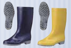
本体:ネイビー 底:グレー 本体:イエロー 底:グレー